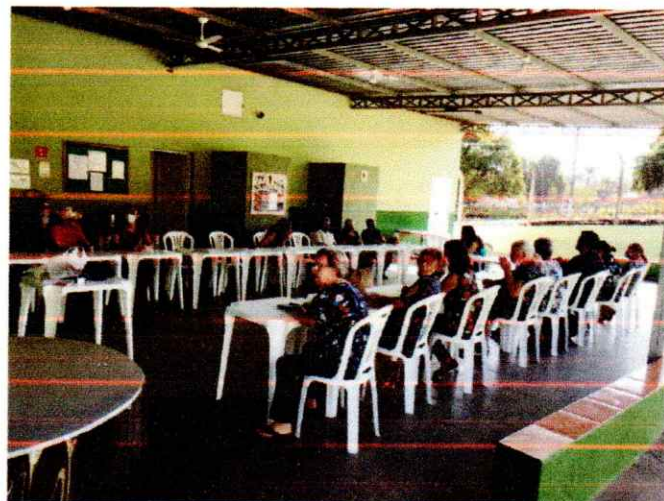
TERAPIA OCUPACIONAL PARTICIPAÇÃO DAS PESSOAS IDOSAS DOS CRAS